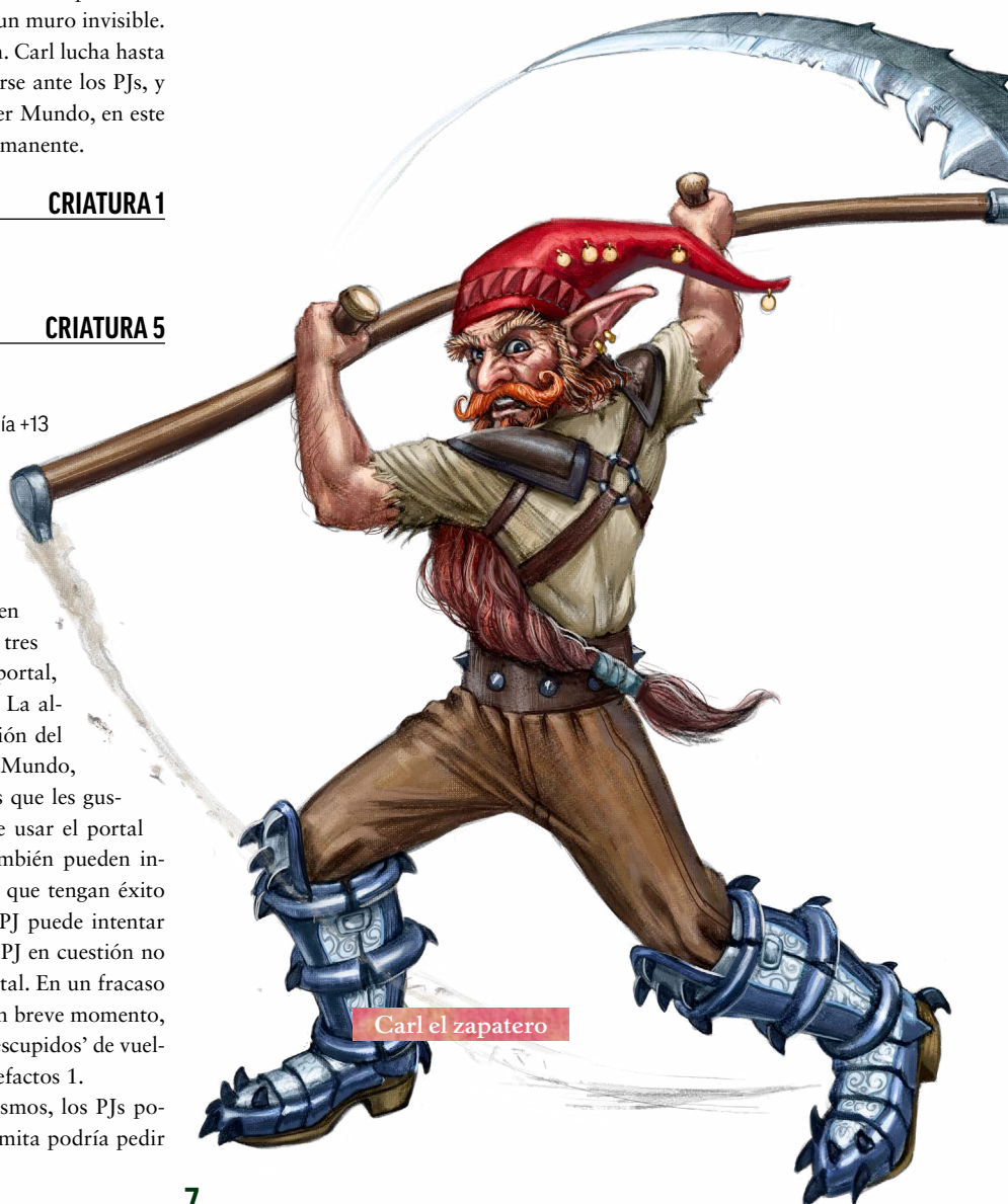
Carl el zapatero

En cualquier caso, ahora que la causa del problema ha sido encontrada (y esperamos que solucionada), nuestros héroes son libres de celebrar su victoria con amigos y admiradores de la forma que consideren oportuna. Pueden disfrutar de un merecido descanso..., ¡hasta que el bosque Verduran los necesite una vez más!